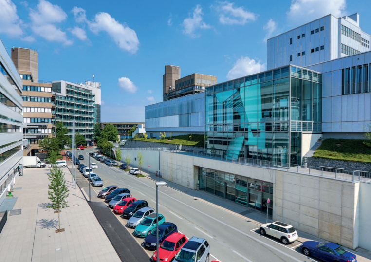
© Sebastian Jarych, Bergische Universität Wuppertal