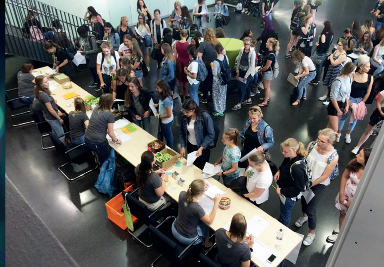
Check-in zur SommerUni

Für Schülerinnen der Oberstufe, Abiturientinnen und junge Frauen