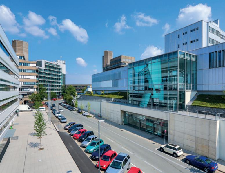
© Sebastian Jarych, Bergische Universität Wuppertal