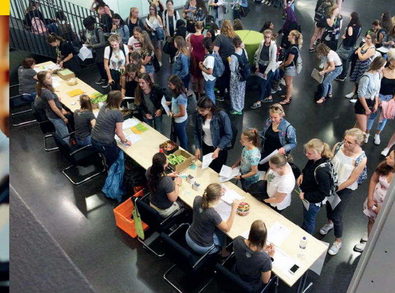
Check-in zur SommerUni

Für Schülerinnen der Oberstufe, Abiturientinnen und junge Frauen